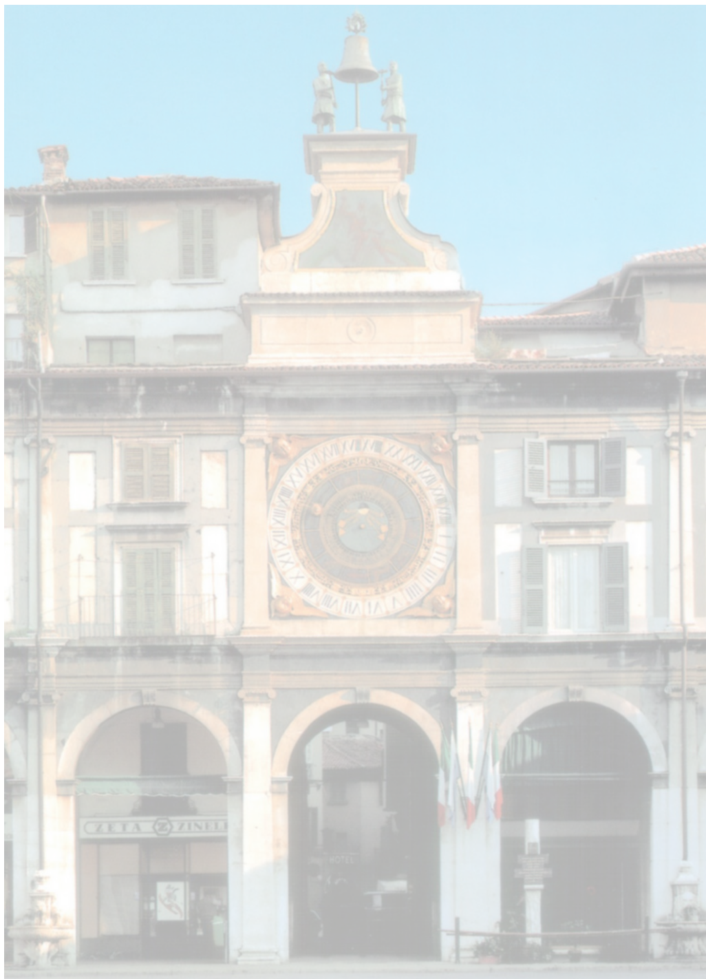
Orologio, Piazza Loggia - Brescia